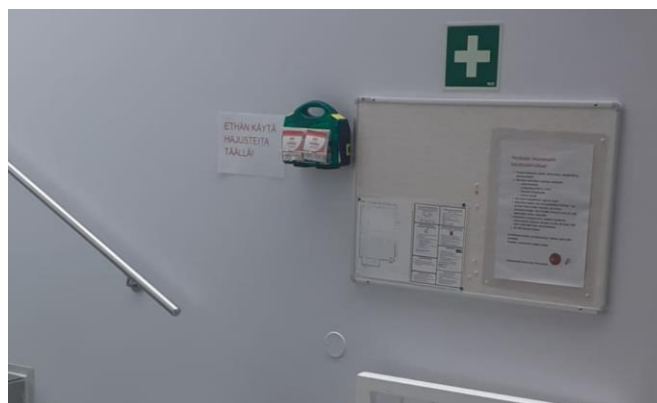
Kuva 3. EA-laukun sijainti liikuntasalissa portaiden vieressä

Tapaturmien varalta seuratyöntekijät vastaavat omasta vakuutusturvastaan. Honkalassa on omat ensiaputarvikkeet EA-laukku kuva 3 sekä Defibrillaattori kuva 4.