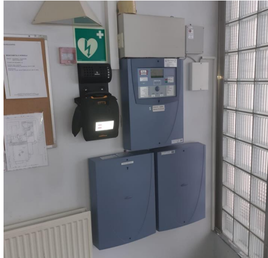
Kuva 4. Defibrillaattorin sijainti yläaulassa pääoven vieressä

Defibrillaattorin käyttö poikkeustilanteissa -> riko ylätasanteen lukkosuojus ja nouda laite kohteella-> ilmoita käytöstä liikuntakeskuksen infoon (vapaa-aikapalvelöut@kankaanpaa.fi) tai 0445772680.