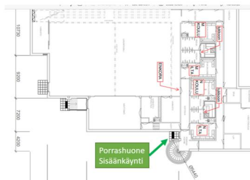
Kuva 1 (sisäänkäynti/porrashuone)

Honkalan kuntosali/painonnostosali on käytettävissä joka päivä klo 6.00–22.00. Käynti tiloihin porrashuoneen kautta (kuva 1).